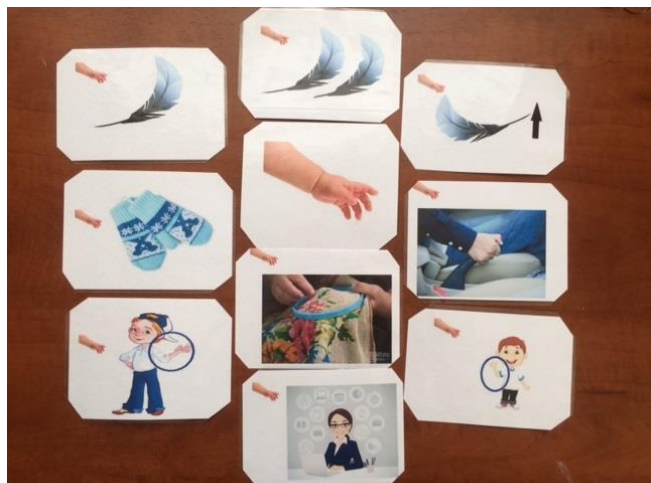
Родственные слова к слову "рука"