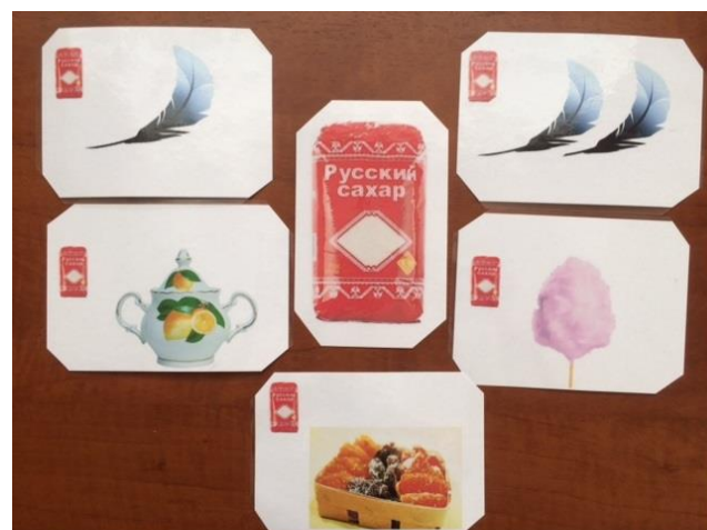
Родственные слова к слову "сахар"