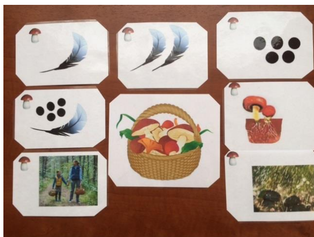
Родственные слова к слову "гриб"