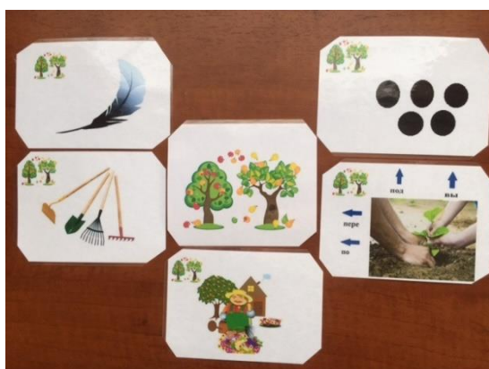
Родственные слова к слову "сад"