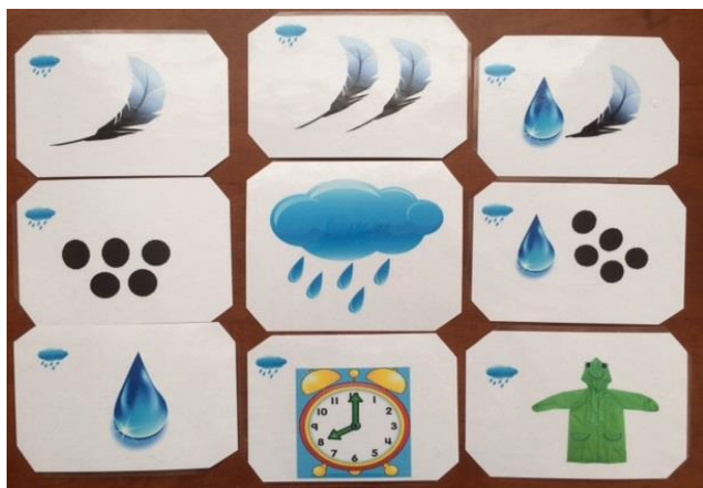
Родственные слова к слову "дождь"