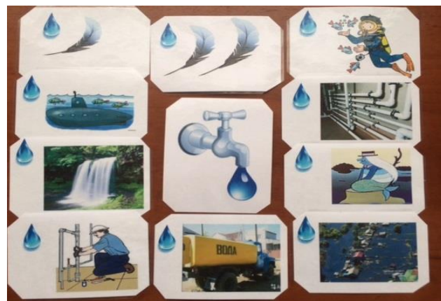
Родственные слова к слову "вода"