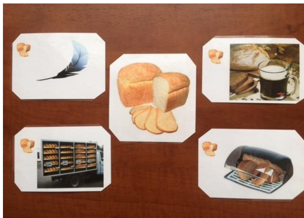
Родственные слова к слову "хлеб"