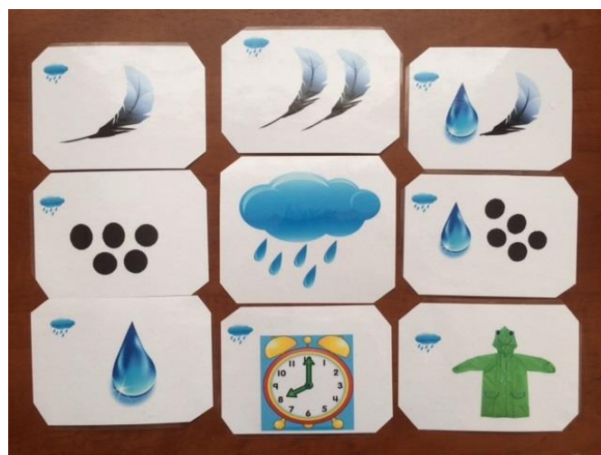
Родственные слова к слову "дождь"