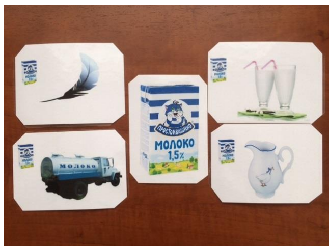
Родственные слова к слову "молоко"