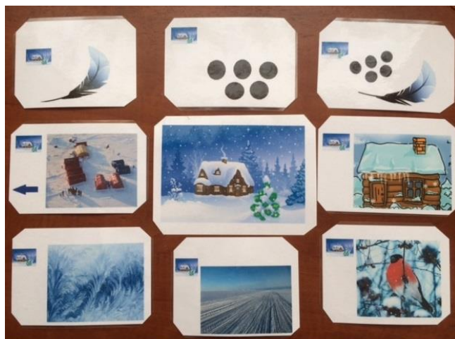
Родственные слова к слову "снег"