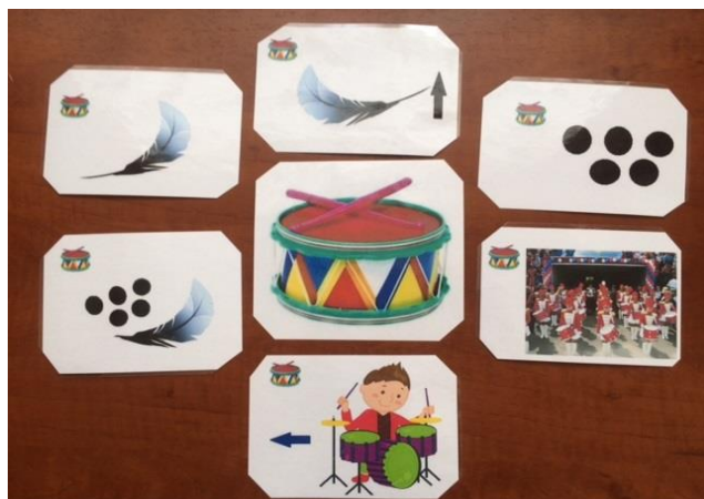
Родственные слова к слову "барабан"