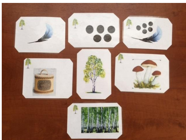
Родственные слова к слову "береза"