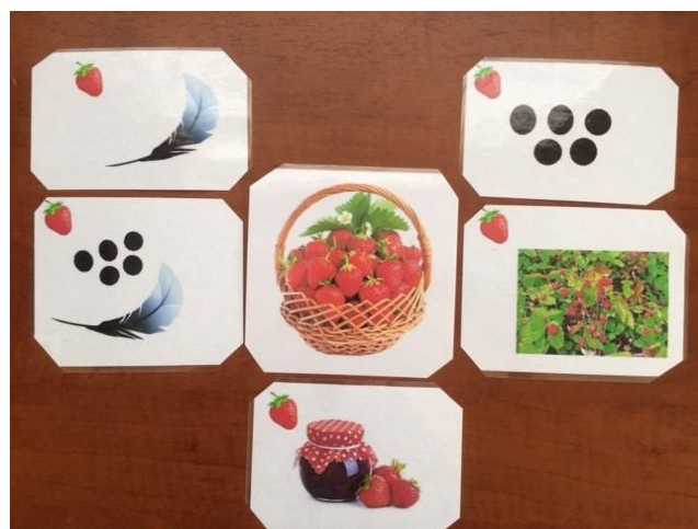
Родственные слова к слову "ягода"