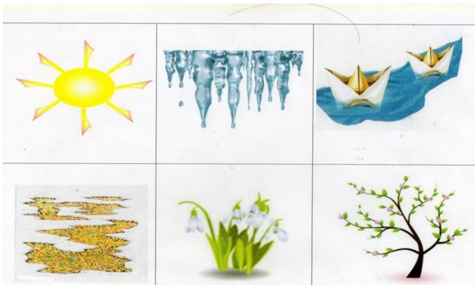
Рассказ по мнемотаблице «Весна» № 2.

Весной пригревает теплое и ласковое солнышко. Тают на крышах сосульки, и появляются лужи. Дети пускают в них кораблики. Тает снег и появляются проталины. Весной распускаются первые цветы — подснежники, а на деревьях появляются зеленые листочки.